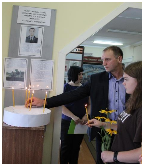
Мемориальная экспозиция в Покровском лицее, посвящённая Кавалеру ордена Мужества Георгию Семенихину