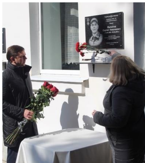
Губернатор Орловской области А.Е. Клычков на церемонии открытия мемориальной доски.