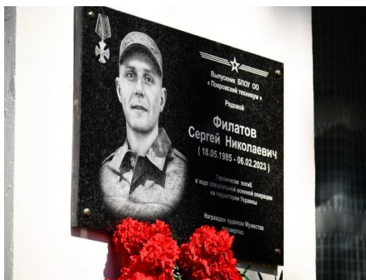
Мемориальная доска в память о Сергее Филатове на здании Покровского техникума.