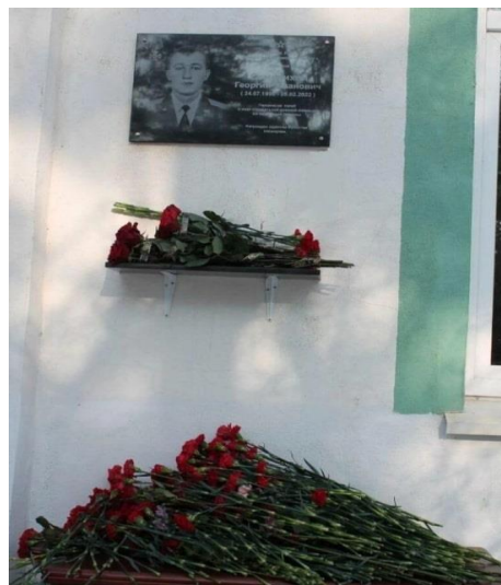
Памятная доска Георгию Семенихину в Некрасовской школе - интернате