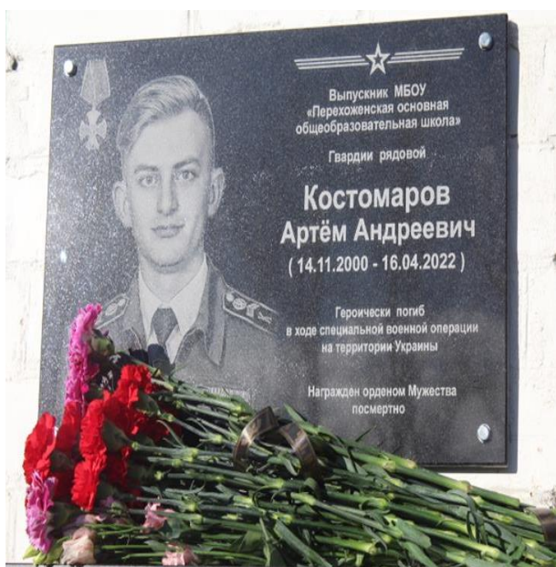
Мемориальная доска в память об Артёме Костомарове на здании Перехоженской школы

29 июля 2022 года в музее Покровского лицея состоялась церемония открытия мемориальной экспозиции, посвященной Артему Костомарову.